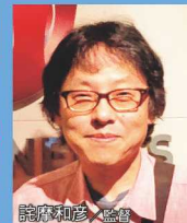
読海和彦 / 監修