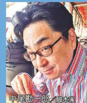
中尾勘一郎 / 脚本家